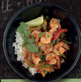
CREVETTES SAUCE PIMENTÉE