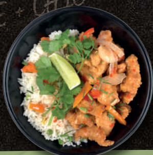
POULET SAUCE AIGRE DOUCE