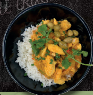
POULET CURRY THAÏ